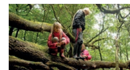
Nationaal Park de Hoge Veluwe