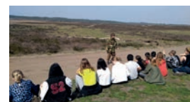
Platform Militaire Historie Ede