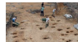
Vakgroep Archeologie, gemeente Ede