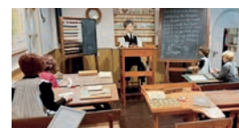
Kijk & Luistermuseum