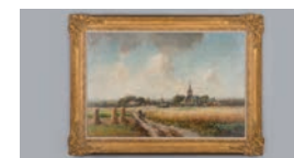
Historisch Museum Ede